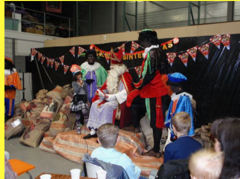
Foto: Lastige vragen van de pieten.

Alle kinderen van de gezinnen die tijdelijk aangewezen zijn op de voedselhulp door de voedselbank waren hiervoor uitgenodigd. En dat was niet aan dovemansoren gericht. Een kleine honderd kinderen waren die middag aanwezig aan de Verlengde Lageweg.